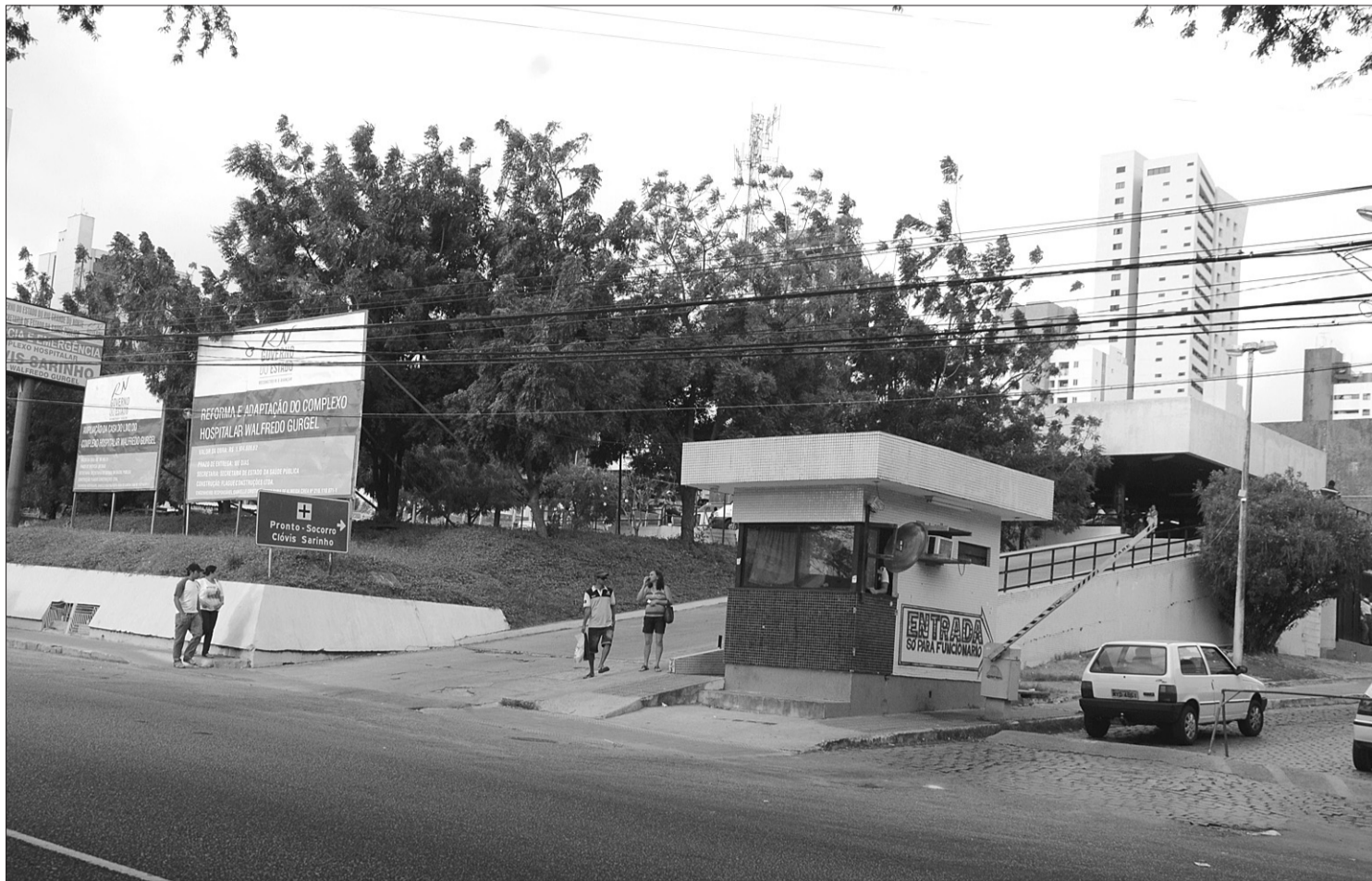
Além dos trabalhadores infectados pelo novo coronavírus, Walfredo Gurgel tem quatro pacientes isolados com sintomas da Covid-19

A situação revela que a epidemia já está dentro das unidades hospitalares do Estado que não estão destinadas ao tratamento de pacientes com Covid-19. No Hospital Monsenhor Walfredo Gurgel, por exemplo, há pacientes que aguardam procedimentos como neurocirurgias e outras ci-