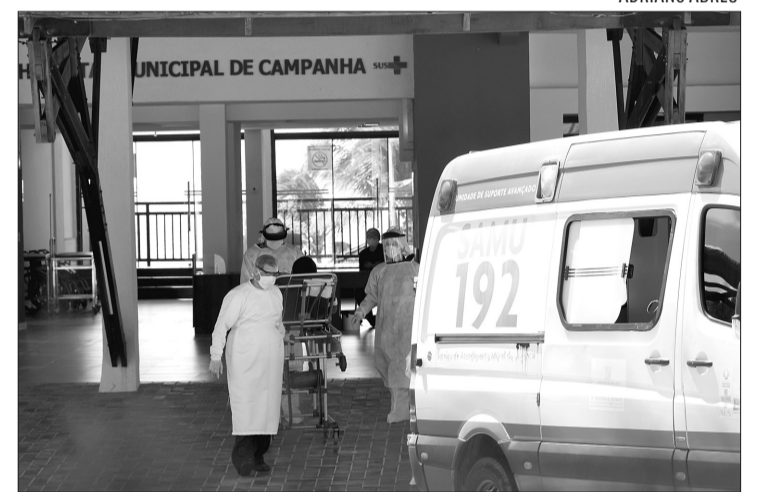
Momento da transferência do paciente para a UPA do Potengi