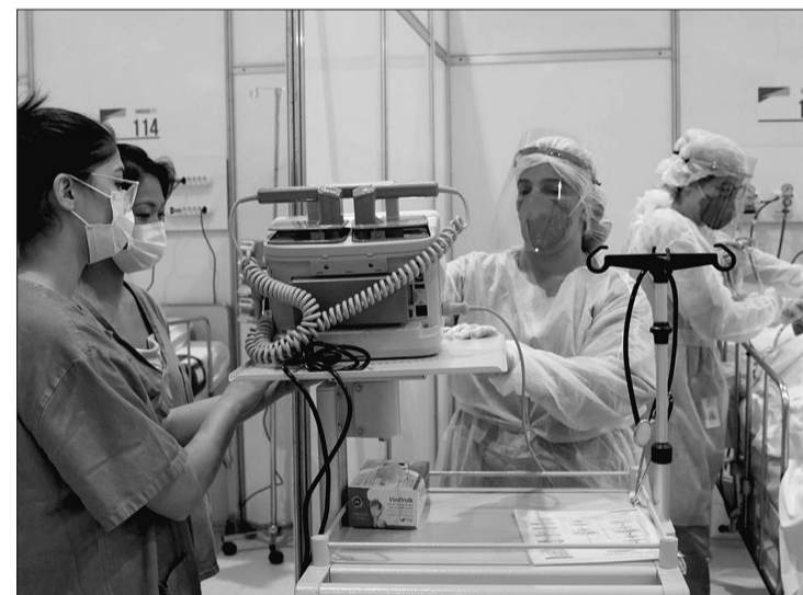
Maioria dos profissionais está na linha de frente de combate