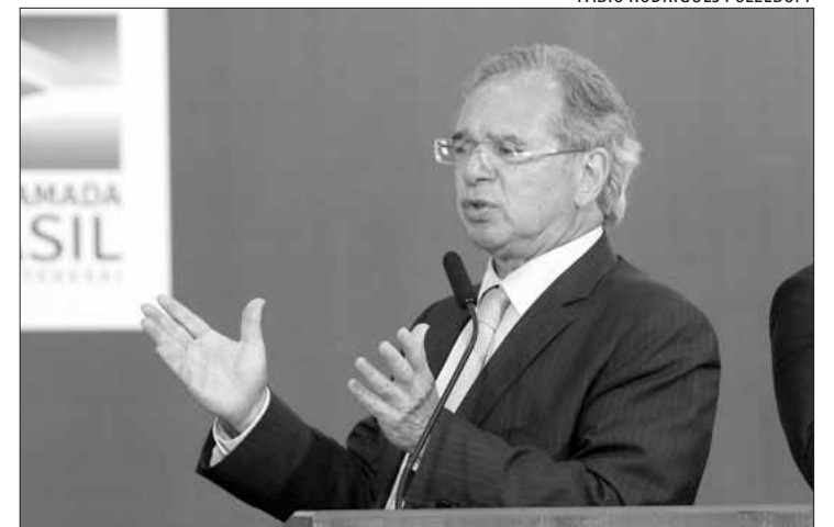
Paulo Guedes diz que a Bolsa vai subir se Bolsonaro vencer