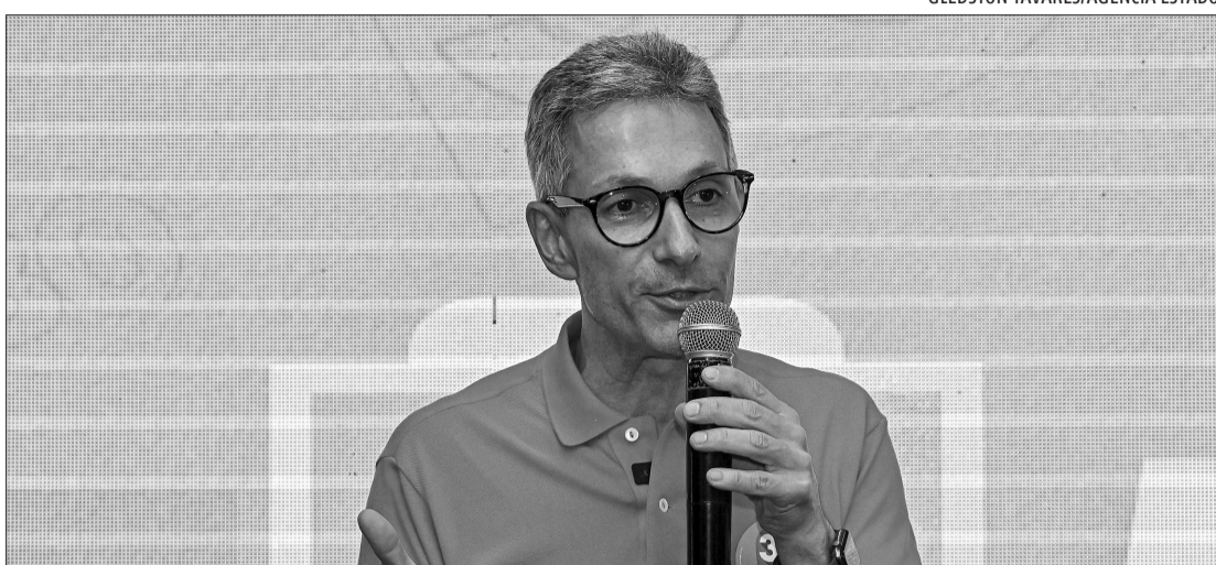
Romeu Zema: "Estamos assistindo a uma arbitrariedade gigante, você não poder discordar"

Zema condenou os atos de vandalismo, mas, para ele, não