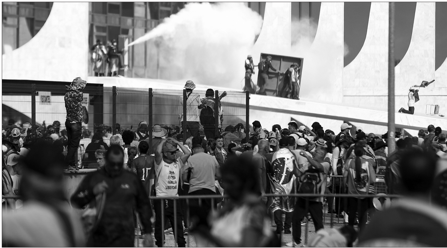
Atos de vandalismo ocorridos no domingo, 8 de janeiro, teve a prisão 39 membros de grupo acusado de associação criminosa armada

Para evitar que os acusados deixem o País, Santos pede que seus nomes sejam inseridos no Sistema de Tráfego Internacional da Polícia Federal. Além disso, é solicitada a preservação de material existente nas redes sociais denunciados. Os 39 radicais foram investigados como 'executores materiais dos crimes' registrados no último dia 8 - ao todo, a PGR apura os